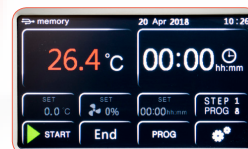
Todo de un vistazo