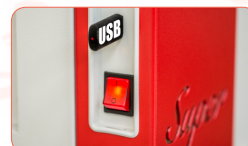
Datalogger integrado para el almacenaje de datos