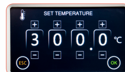
¡Fácil de utilizar, incluso con guantes!